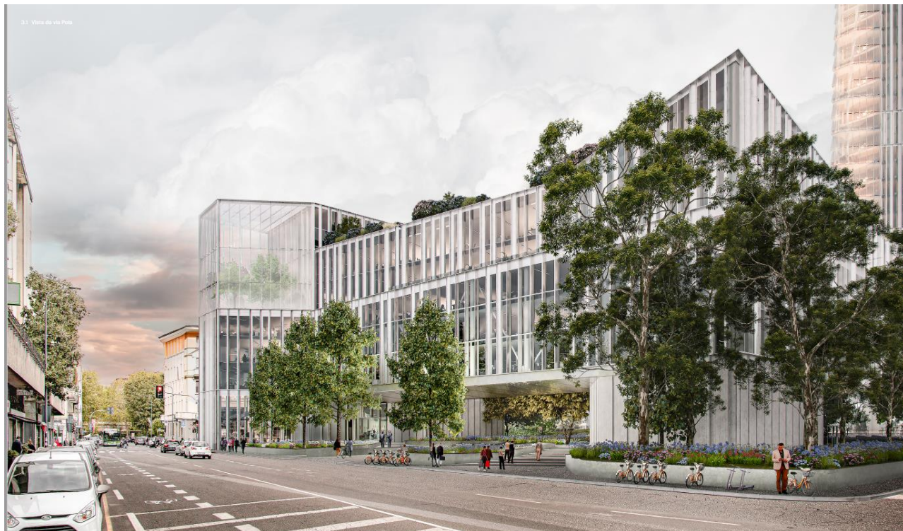
Ingresso da via Pola