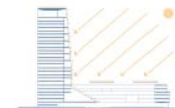
Pannelli solari in copertura e vetri fotovoltaici