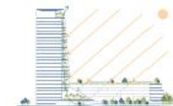
Bioclimatica e isole di calore: raffrescamento naturale del progetto e protezione dall'irraggiamento solare grazie al sistema dei giardini pensili

Altezza Torre h 122,50 m per 26 piani totali