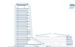
Raccolta acque meteoriche tramite vasca di laminazione